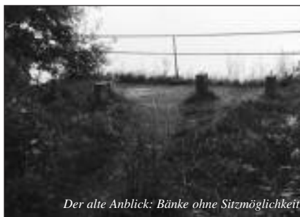
Der alte Anblick: Bänke ohne Sitzmöglichkeit

Schon viele Jahre boten die ehemaligen Bänke am Görslower Ufer unterhalb des Raben Steinfelder Parks ein trostloses Bild. Nur noch Betonfüße oder ihre Reste waren davon übrig geblieben. Auf unser Anliegen, einige Bänke im Interesse vor allem älterer Spaziergänger wieder aufzubauen, stießen wir beim NABU als Besitzer des Naturschutzgebietes, aber auch beim Bürgermeister der Gemeinde, auf taube Ohren.