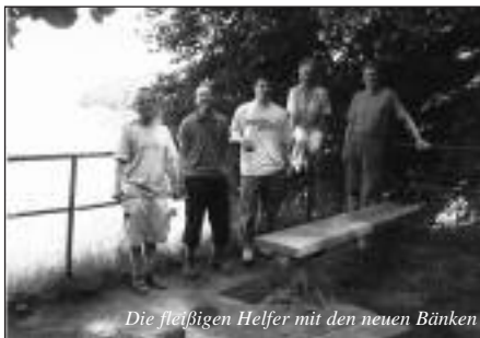
Die fleißigen Helfer mit den neuen Bänken